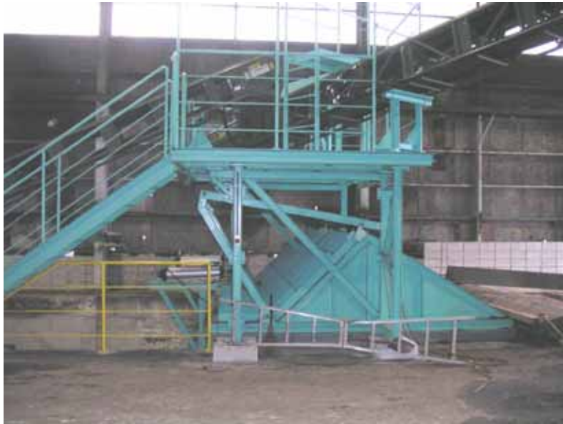
原料受入ホッパー