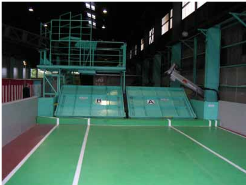
原料受入ホッパー